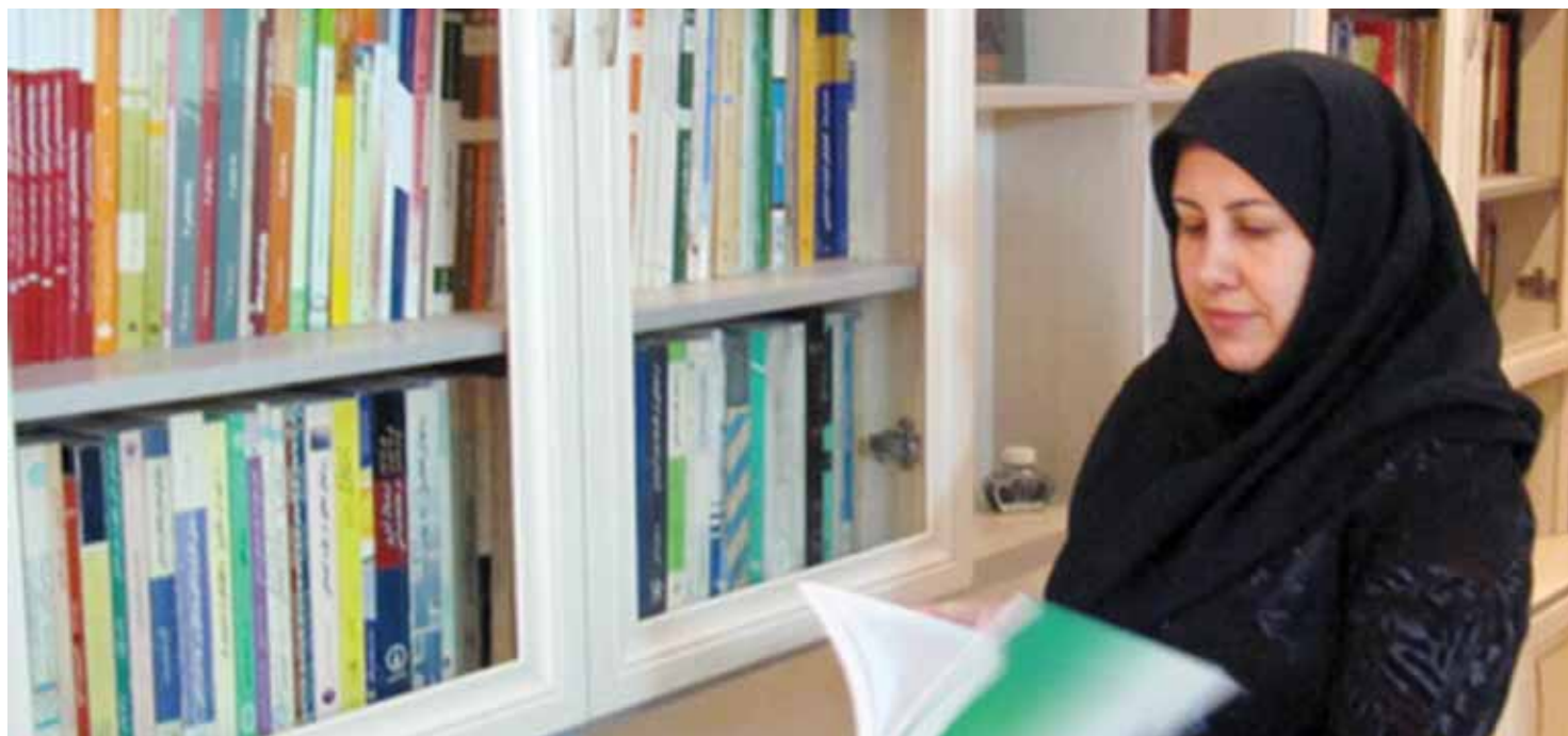
روانشناسی اشتغال زنان؛ چالش‌ها و راهکارها