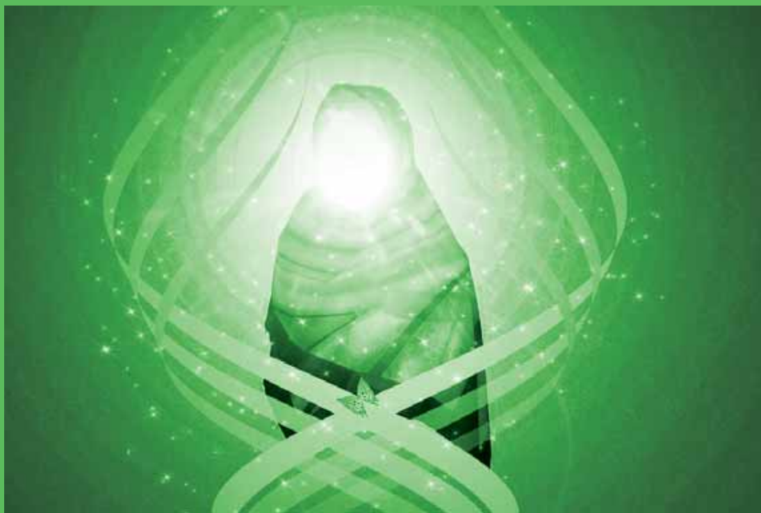
مقوله‌ای به نام حجاب زن ایرانی پیش از اسلام

پاسخ به این پرسش آسان نیست، چراکه مورخان همیشه درباره جنگ‌ها، کشورگشایی‌ها، روش زمامداری و جهان‌گشایی حاکمان می‌نوشتند. در واقع نوعی تاریخ‌نگاری نظامی در دوره باستان وجود داشت و به‌ندرت به مسائل اجتماعی توجه می‌شد و اگر کسی